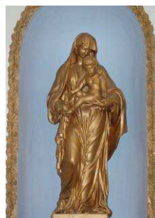
Autel Privilegié (Vierge)

A découvrir : la chaire, le Christ en Croix, les statues de Saint Joseph, Sainte Thérèse, Saint Antoine, du Sacré Cœur, et le confessionnal, etc.