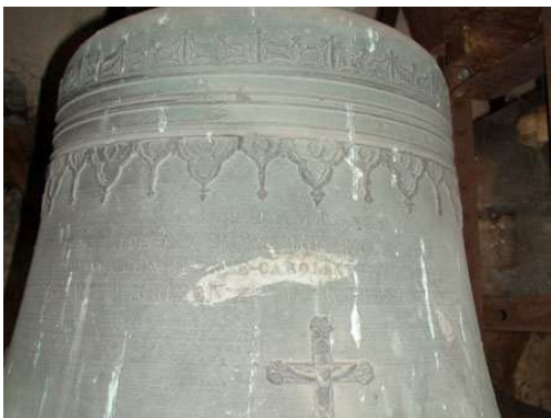
(Cette cloche a été classée le 27 avril 1944)