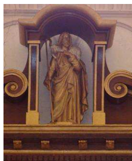
Jésus le Bon Pasteur

La grille à la tribune est-elle celle qui délimitait autrefois le chœur ?